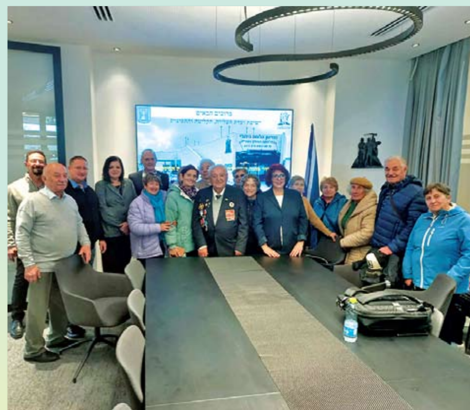
Группа участников заседания парламентской комиссии кнессета в Латруне. 2024 г.