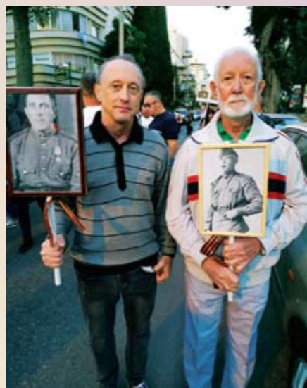
Память – она священна. Праздничный день в Петах-Тикве

В соседнем городе Гиват-Шмуэль, куда меня пригласили, мне было приятно пообщаться с местными ветеранами, с вдовами инвалидов и ветеранов войны и лично поблагодарить за Великую Победу. Несмотря на свой преклонный возраст, они продолжают активно заниматься общественной работой, декламируют на встречах стихи, на досуге разгадывают