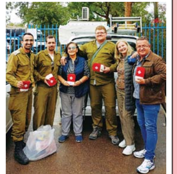
מתנדבי איגודי הנכים ויוצאי המלחמה מעבירים ערכות עזרה ראשונה לכיס ליחידה הצבאית לחיילי מילואים