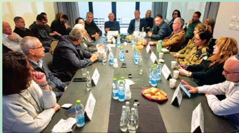
קבוצת משתתפים בישיבת הוועדה הפרלמנטרית של הכנסת בלטרון. שנת 2024.