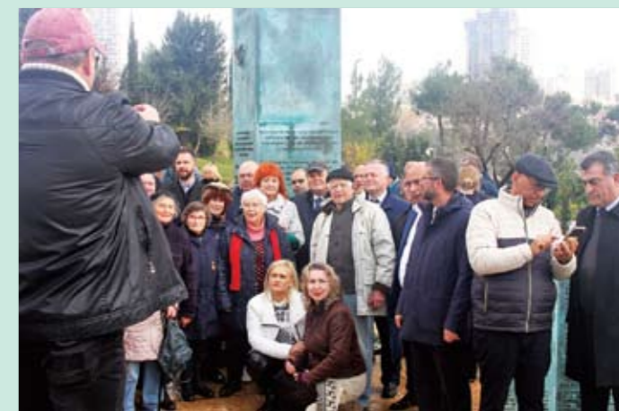
«Свеча Памяти». К 80-летию освобождения от блокады Ленинграда. Митинг у Монумента Памяти. Иерусалим. 2024 г.