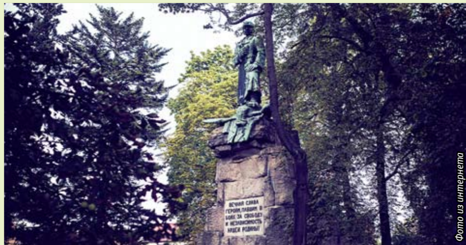
Братская могила. Познаньское воеводство. Город Вольштын

Данной теме посвящен проект, руководителем которого я