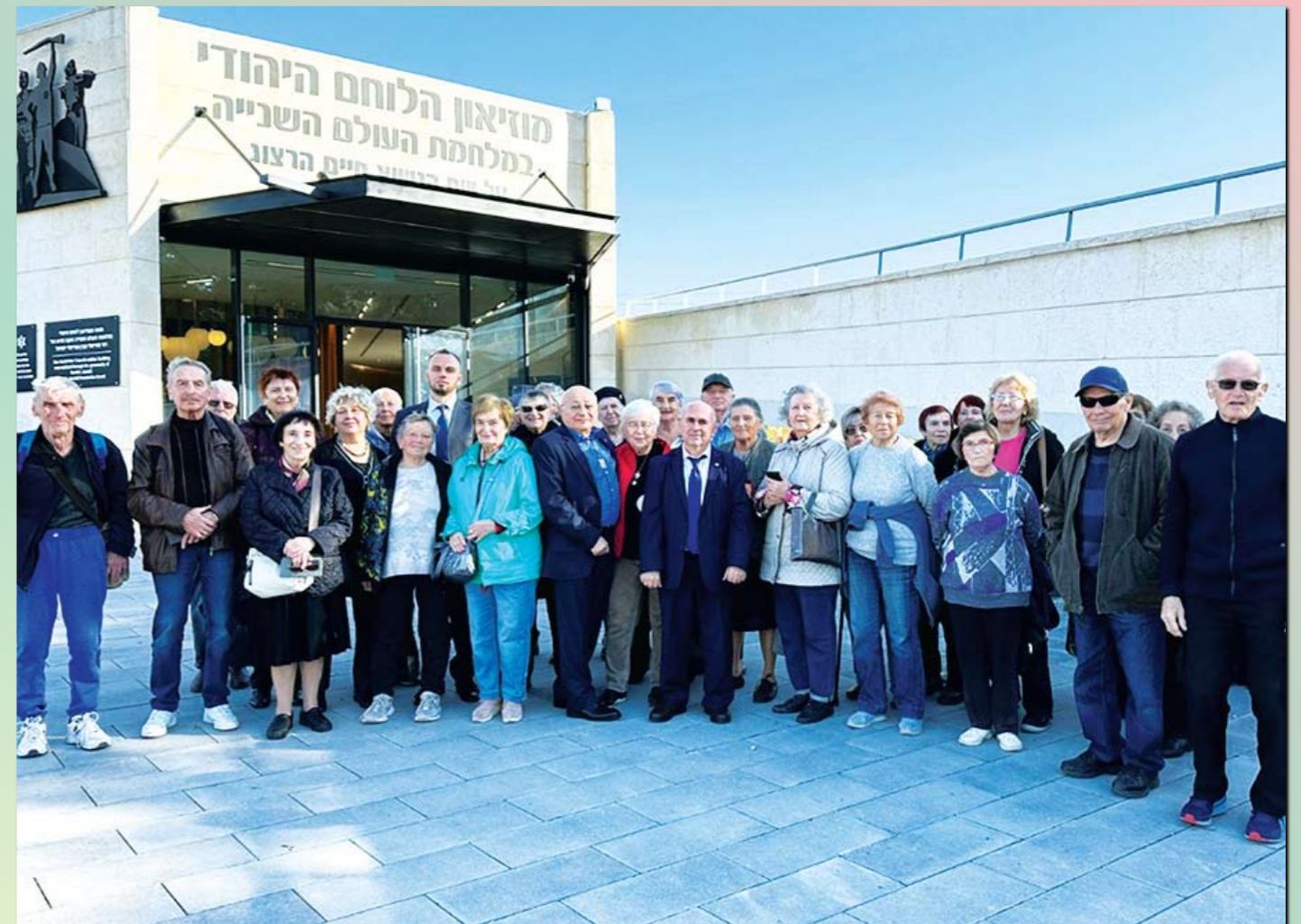
טרון - 26.12.2023. "בוגרי" המוזיאון. המוזמנים.