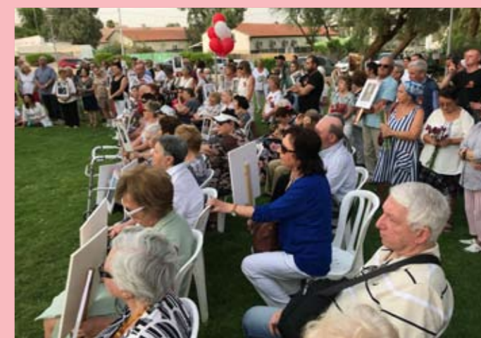
Эйлат. Парк Фрадкин