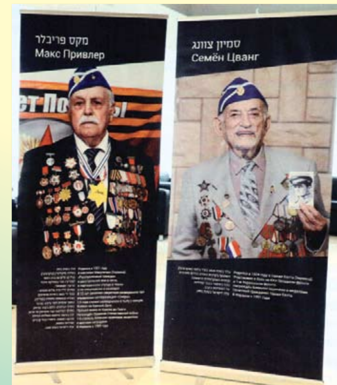
Стенды героев войны. Выставка в кнессете Нет героев – нет стендов

На гостевых трибунах кнессета в этом году немногочисленно. Приглашения и оформление