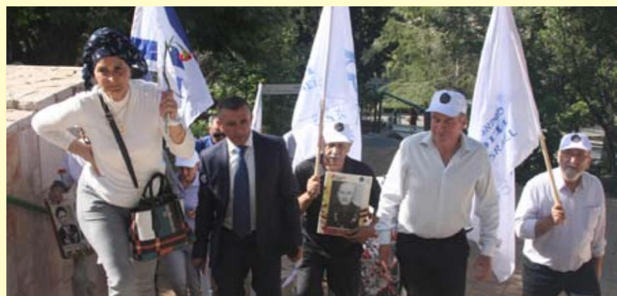
Старт шествия «Бессмертный полк» – гора Герцля, от Мемориала в Иерусалиме – по всей стране