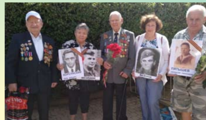
Группа из подразделения «Бессмертный полк» (Беэр-Шева)