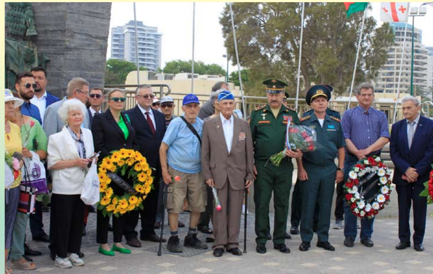
22.06.2022 г. Нетания. «Крылья Памяти». Минута молчания