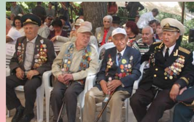
В почетном ряду. Победа-77. Иерусалим

Беэр-Шева – колонной на митинг к пл. Победы, 9:00