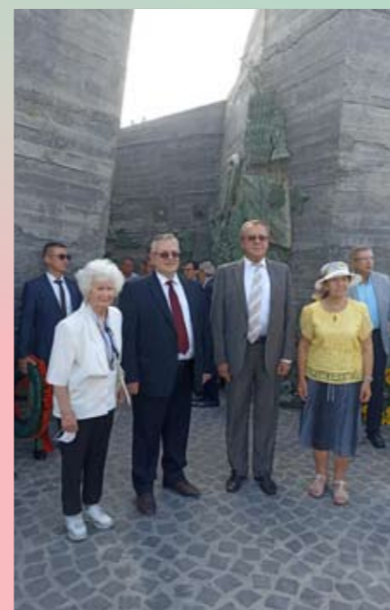
«Крылья Памяти» – 22.06.2022