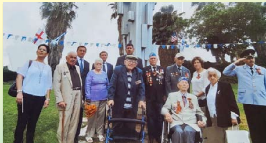
«Свеча памяти». Иерусалим. Митинг. 22.06.2022