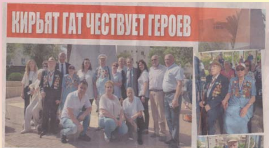
Фрагмент из еженедельника «Мост»

Мэр знает, что сюда пришли те, кто ценит его и голосует за него. Своим избирателям, а это мы – все, он нашел главные слова обращения: