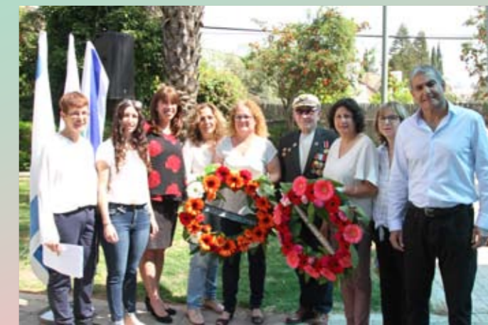
Петах-Тиква и Гиват-Шмуэль – соседи и соратники

На следующий день я поехал в пригород Петах-Тиквы – Гиват-Шмуэль, С этим красивым