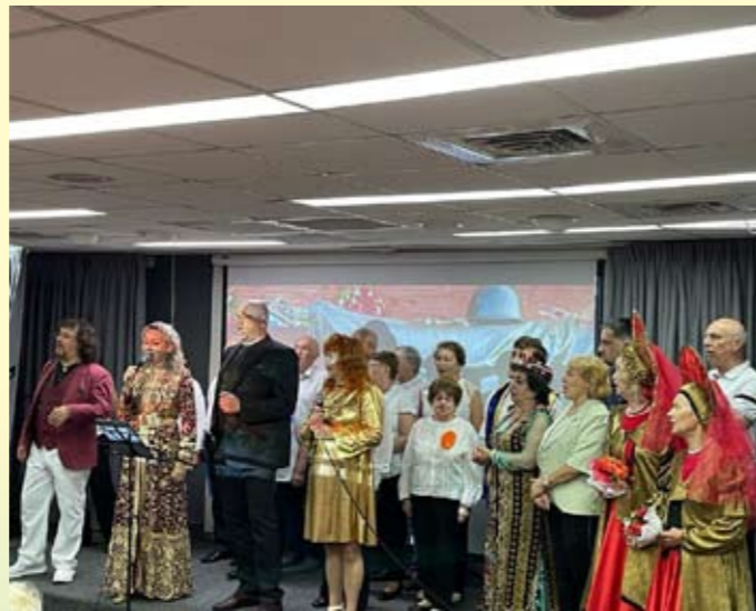
Музыкальный поклон памяти павших воинов и в честь победителей-сибиряков от группы исполнителей концертной программы

Выступления разножанровых исполнителей были яркими иллюстрациями высокого уровня