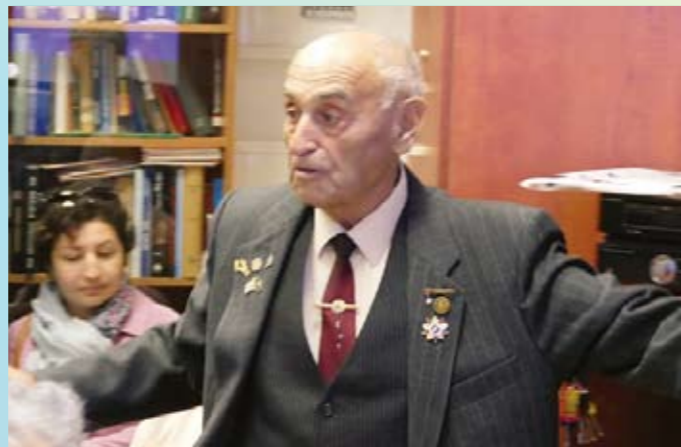
Президент о планах и бюджете

По принятому правилу «Продолжение следует» президент пожелал достойно отметить следующие День Независимости, День Победы, открытие Музея в Латруне, предстоящий выпуск