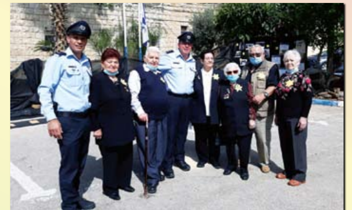
О доставке подарков фронтовикам и узникам гетто позаботилась городская полиция