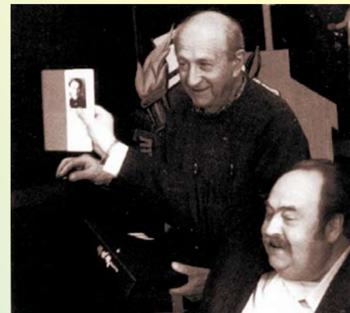
Посол РФ Александр Бовин на презентации книги «Мои боевые друзья»

Деталей мой собеседник не знал, да и армейская суета быстро отвлекла нас от начатой