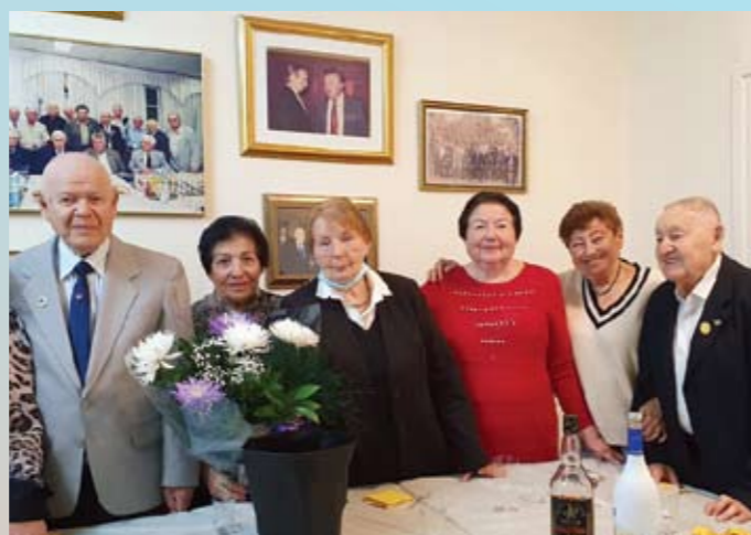
Женсовет рапортует ЦК Союза об успехах и заботах. 7.03.2022. Реховот

очередного журнала, чествование юбилярво-долгожителей, семейные торжества.